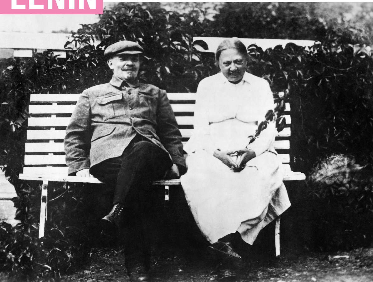
▼ Lenin és Nagyezsda Krupszkaja