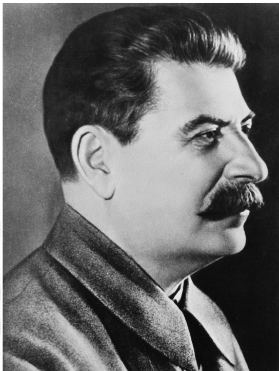
◀ Jozsef Visszarionovics Sztalin