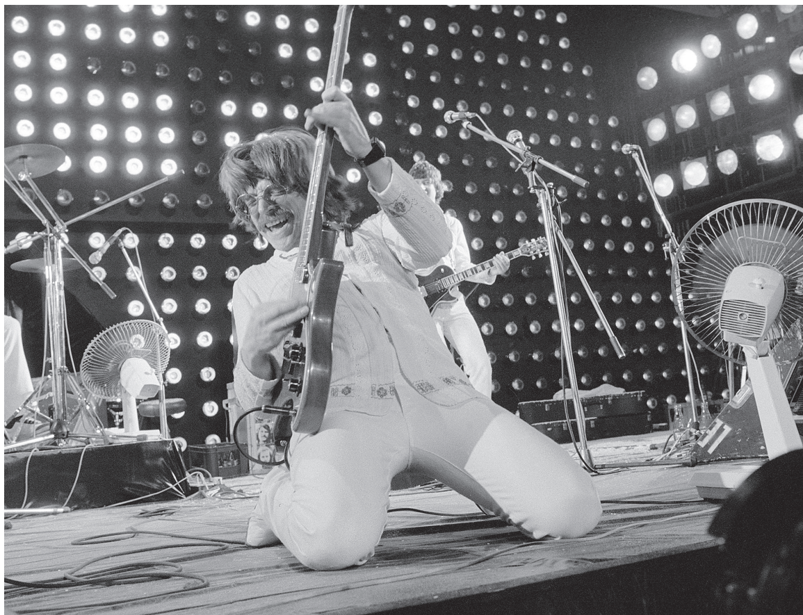
A Koncert egy szimbólummá nemesedő zenekar, az Illés megidézése volt (Szörényi Levente)

dalon). És végül jól járt a közönség is, amely nemcsak jól szórakozott, de önmagát is odaálmodhatta a filmvászonra a szereplők mellé.