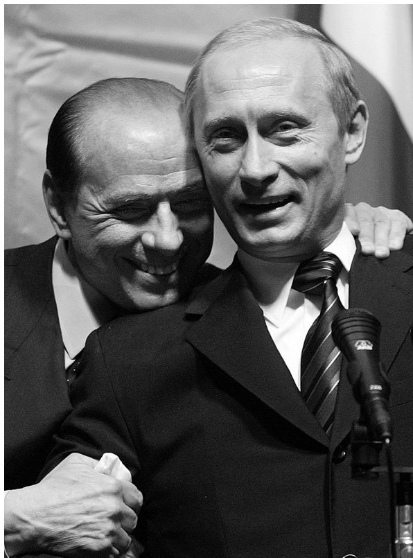
Berlusconi és Putyin közös sajtóértekezletükön Lipeck- ben, 2004. április 21-én