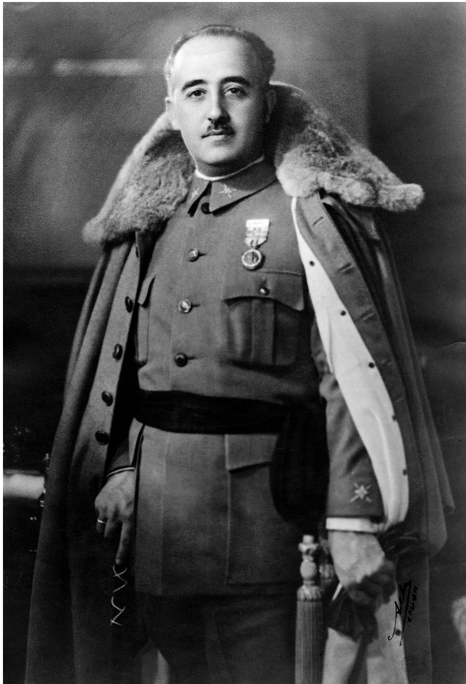
Francisco Franco 1936-ban