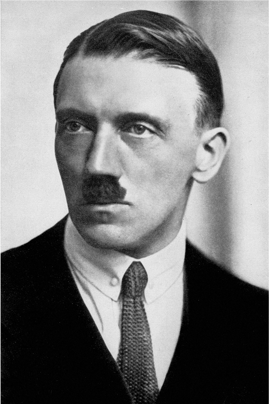
Adolf Hitler 1923-ban