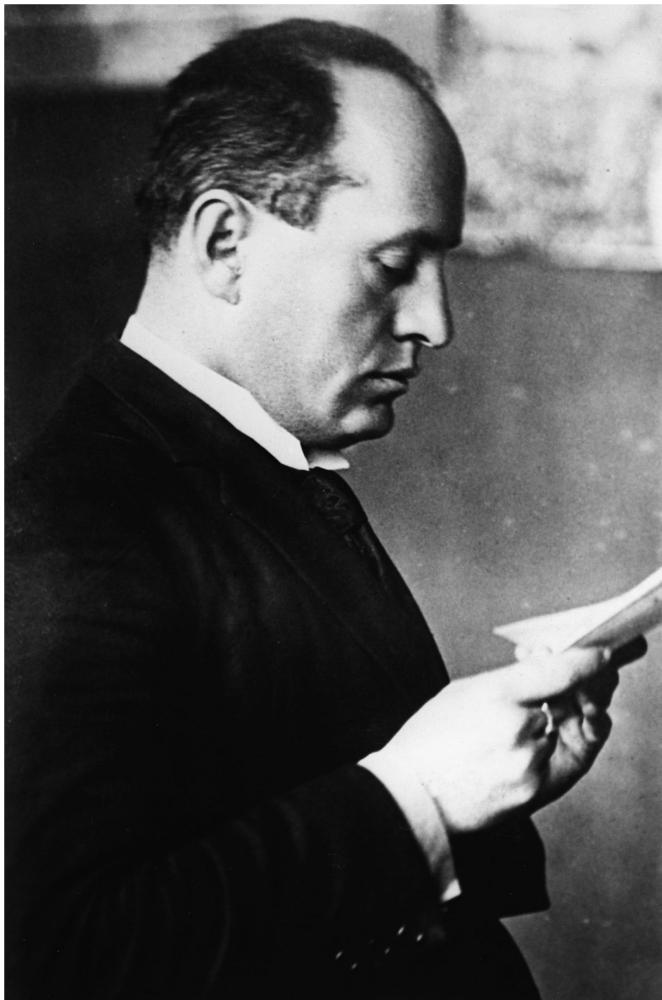
Benito Mussolini az 1920-as években