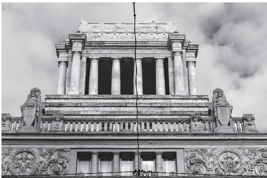
A legfelsőbb legfelsője – a Kúria épületének részlete, 2021. december 3.

Ma benyújtjuk a Kúriához a frekvencia-megnemhosszabbítási per fellebbezését.