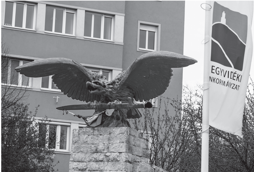
A (H)egyvidék ékessége, 2021. április 11.