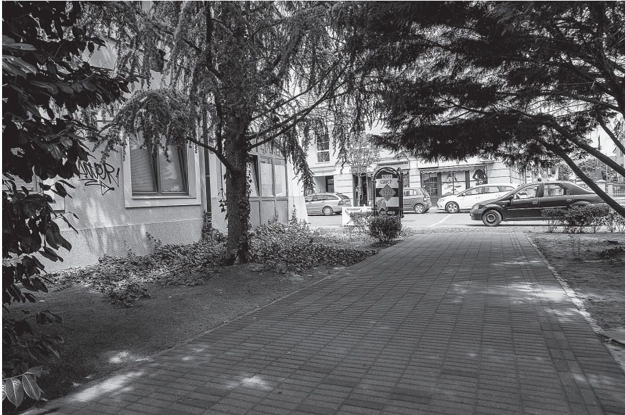
Bokor utca 1-3-5, 2021. július 2.