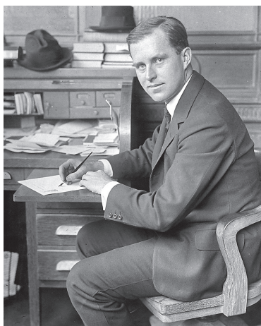
Joseph Kennedy 25 évesen, bankigazgatóként

Joe villámgyorsan növelte egyetemistaként megalapozott vagyonát (diákkorában nem idegenkedett a hétköznapi munkáktól sem, például az egyik nyári szünet alatt autóbust bérrelt, és idegenvezetést tartott, amivel több ezer dollárt keresett).