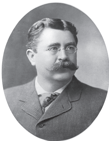
Patrick Joseph Kennedy 1900 körül

első gyermekük, JFK apja, Joseph Patrick (Joe) Kennedy. A családnak még további három gyermeke született, közülük két lány érte meg a felnőttkort. Őket Joe egy életen át támogatta. Rendszeres volt közöttük a levélváltás és később a telefonálás.