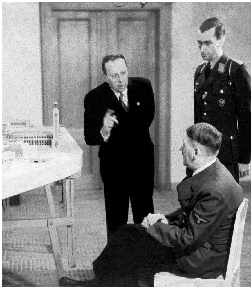
Hermann Giesler építész ismerteti Hitlerrel a Linzre vonatkozó terveit.

hogy politikai küldetése befejeztével Linzbe vonul vissza, de most már elfogadta, hogy Berlinben kell meghalnia. Mindössze annyit tehetett, hogy képeit a gyermekkora színterét jelentő városra hagyományozta.