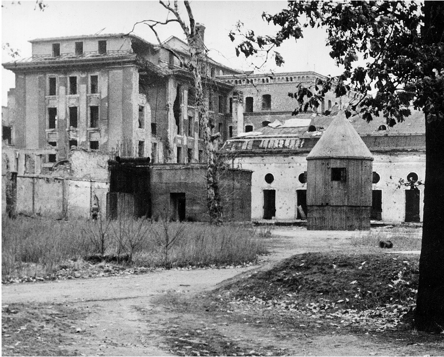
A német kancellária romjai a bunker bejáratával és az SS-örök tornyával – Berlin, 1945.

sereg, hogy áttörje a Vörös Hadsereg vonalait, amely ekkor már körülzárta Berlint. Nem volt új csodafegyver, amely a Németország feletti égboltról számúzta volna a szövetségesek repülőit. A vereséget még keserűbbé tette, hogy a vezért néhány legközelebbi, legrégebbi szövetségese is elárulta. Olaszországból is rossz hírek érkeztek: Mussolinit elfogták, a katonái pedig megadták magukat. A megtépázott német hadvezetés maradéka a Balti-tenger melletti, meggyengült enklávékra összpontosított, ahol Dönitz admirális és Himmler irányította a Wehrmacht és a Waffen-SS* maradványait.