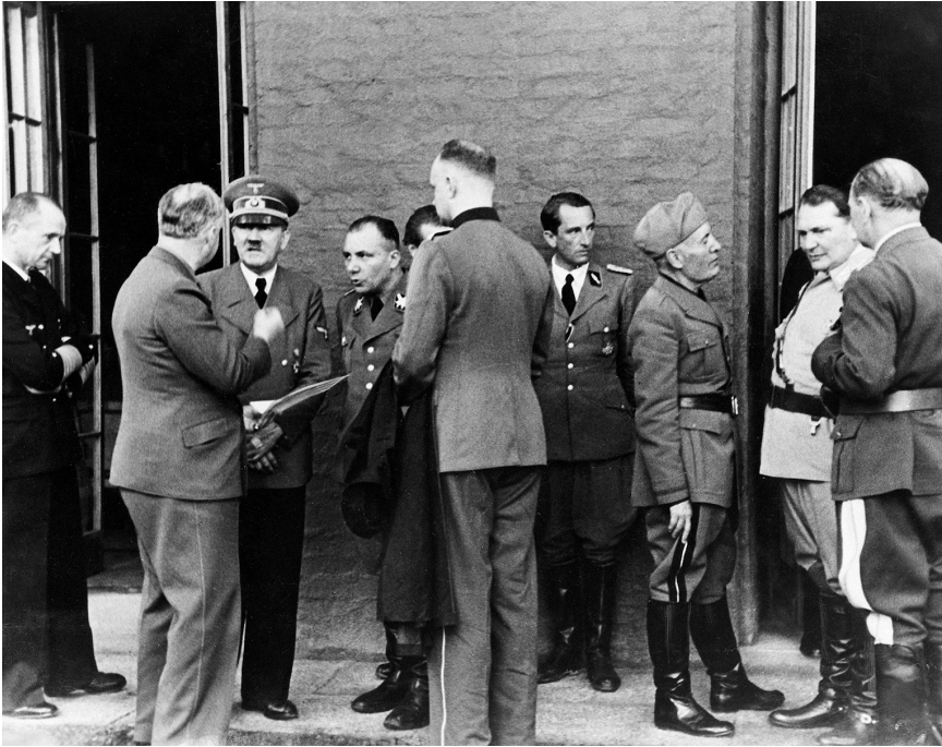
Martin Bormann figyelmesen hallgatja főnöke, Adolf Hitler és von Ribbentrop beszélgetését. A bal oldalon egyedül álló férfi Dönitz admirális; a középben, háttal álló magas figura pedig Hitler inasa, Heinz Linge. Jobbra tőlük a csákós Mussolini cseveg a testes Hermann Göringgel – Farkasverem, 1944.