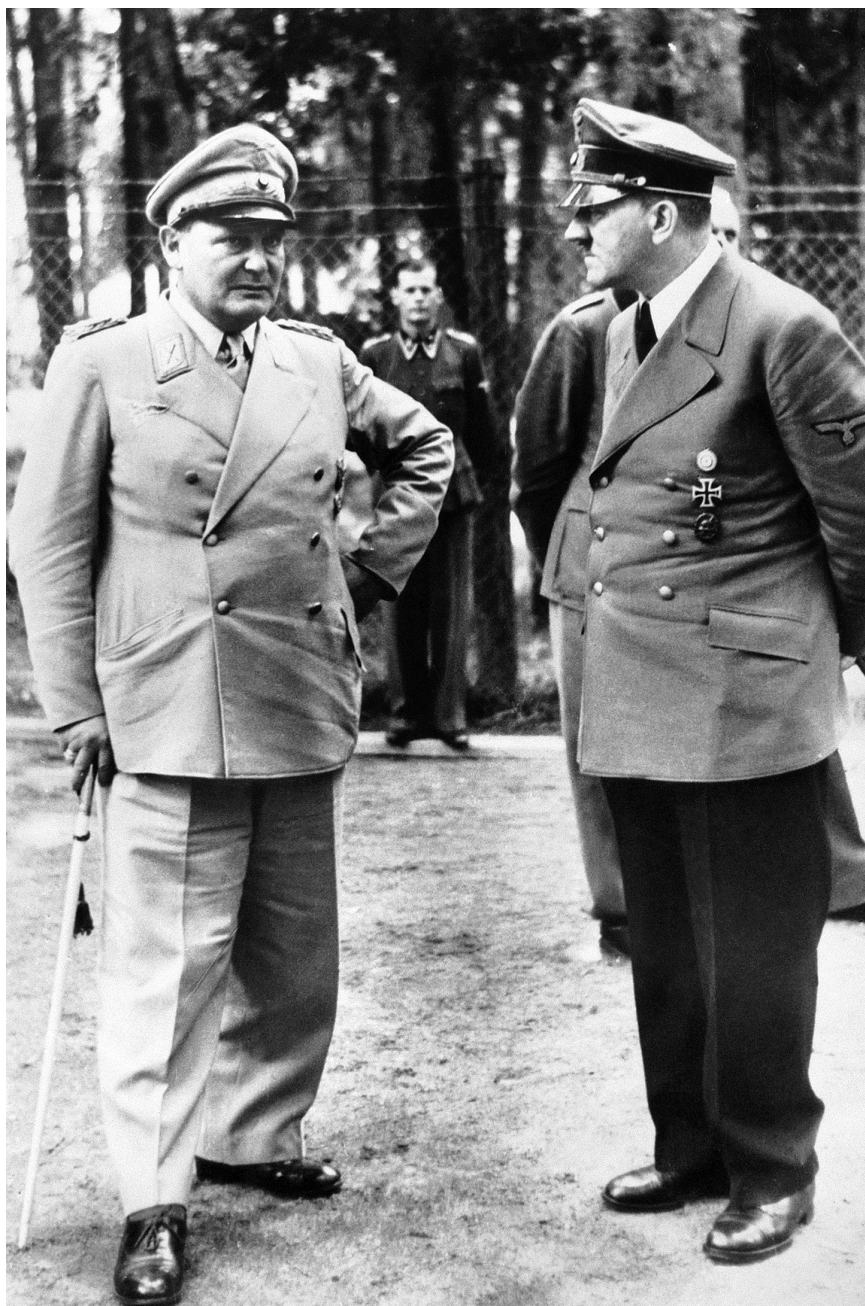
Göring és Hitler az 1944 júliusában végrehajtott merénylet után. Hitler megtiltotta ennek a képnek a megjelenítését, mert nem tetszett neki, hogy az arcuk és a testtartásuk aggodalomról és fáradtságról árulkodik.