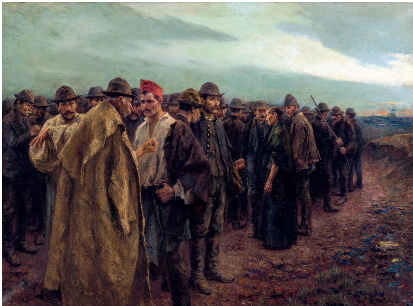
4. Révész Imre: Panem

Nem az volt a baj, hogy a nemzet nagynak álmodta magát, a baj az volt, hogy urainak legtöbbje mindeközben nemigen volt tisztában a mind kedvezőtlenebb nemzetközi körülményekkel, s itt-hon nemhogy nem tettek szinte semmit a nép nemzetbe emelésének érdekében, hanem éppen az áldatlan állapotokat akarták mindenáron konzerválni.