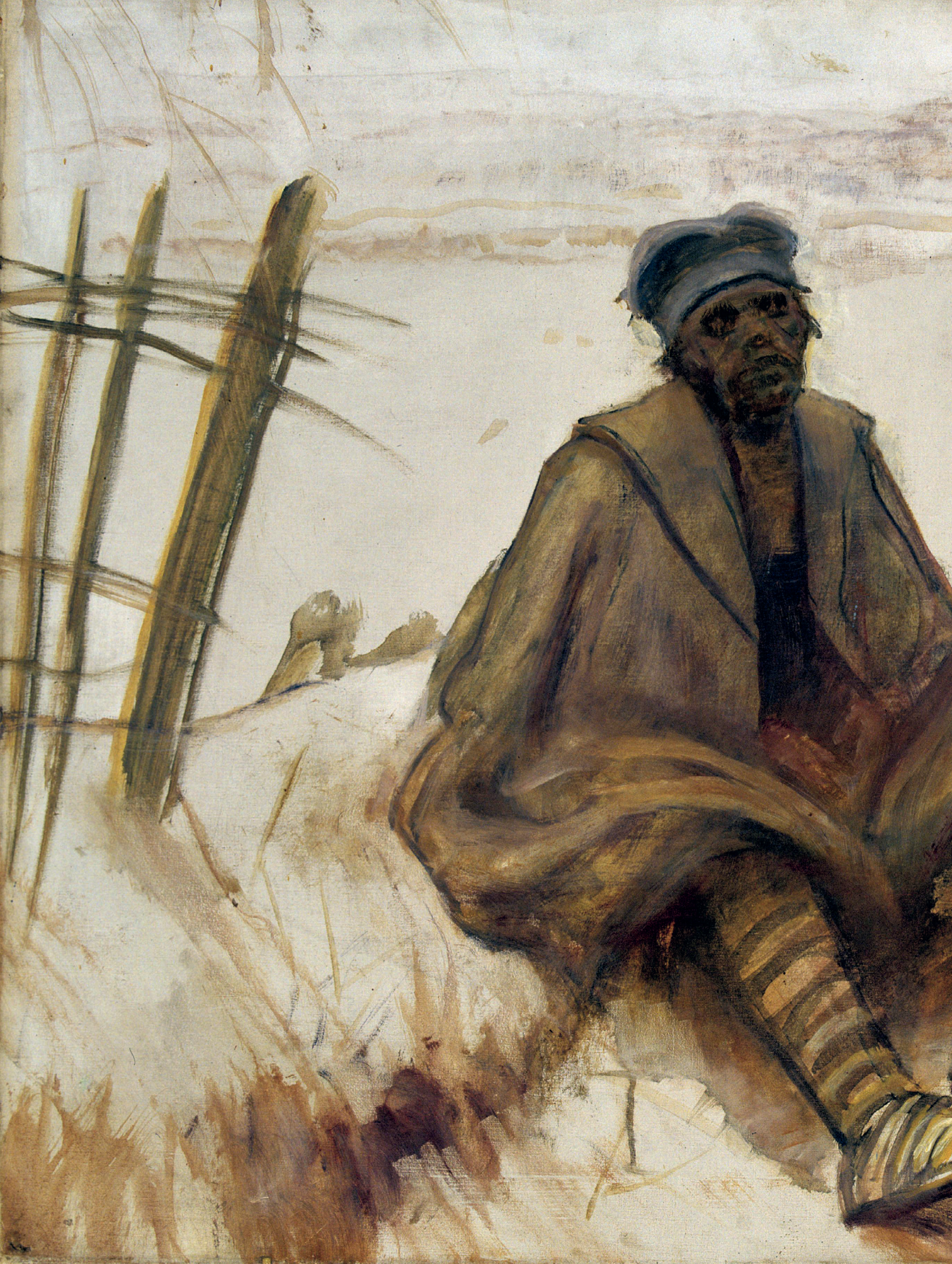
7. Mednyánszky László: Szerbiában (1914)