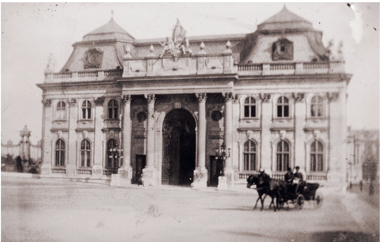
3. A királyi palota a századelőn

A Duna másik oldala fölé magasodó királyi palota is a századfordulón újult meg úgy, hogy közben méretében, tömegében megkétszereződött. Megkétszereződött, miközben funkcionális értelme nemigen volt, hiszen a közös uralkodó Bécsből irányította birodalmát.